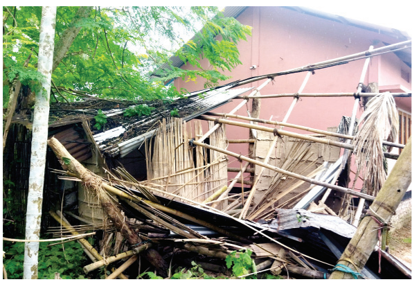
গুৱাহাটী বিশ্ববিদ্যালয়ৰ ভৱন।